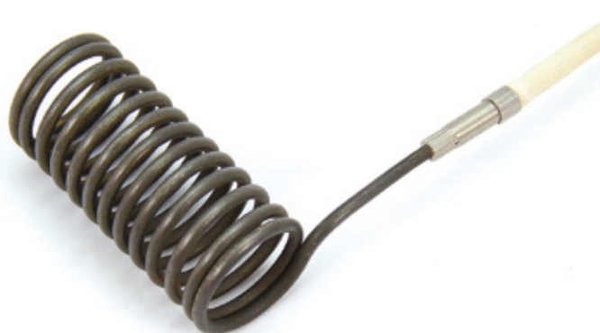
MODELOS ESTÁNDAR CON Y SIN TERMOPAR Fe-Cu Ni "J"