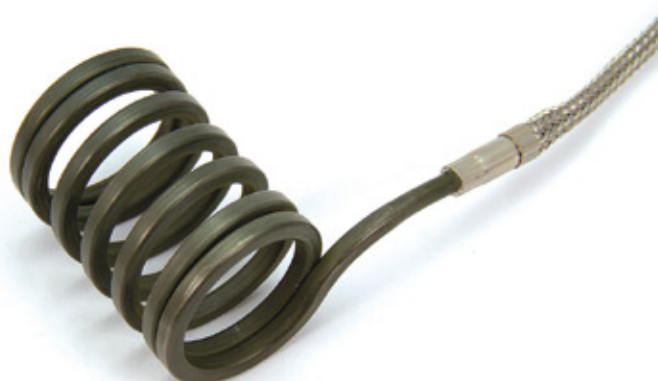
MODELOS ESTÁNDAR CON Y SIN TERMOPAR Fe-Cu Ni "J"