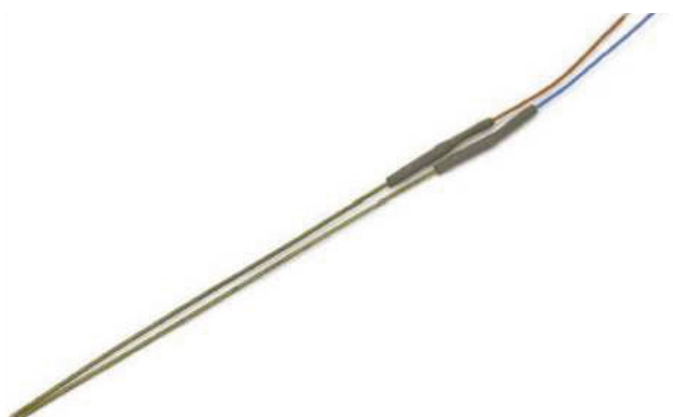
1,80 x 3,60 ESCALONADA