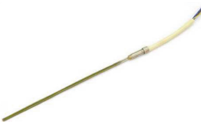
1,80 x 3,60 PARARELA