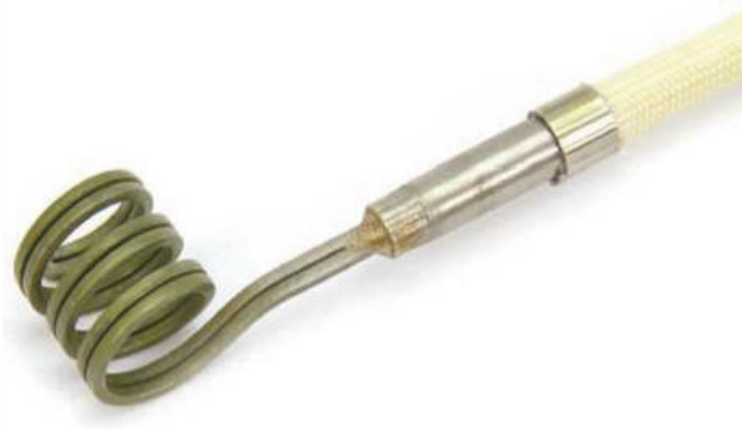
1,80 x 3,60 PARARELA