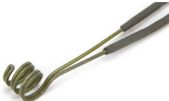
1,80 x 3,60 ESCALONADA